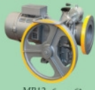
اکمپ سیکور MR12